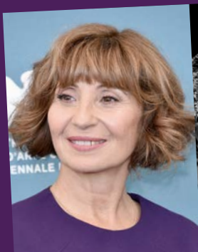
L'actrice Ariane ASCARIDE sera parmi nous !

Au 109, le pôle des cultures contemporaines de Nice (jauge limitée, sur réservation sur notre site) : lectures, projection de films, débats, exposition photo, concerts.