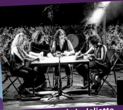
Les Dames de La Joliette